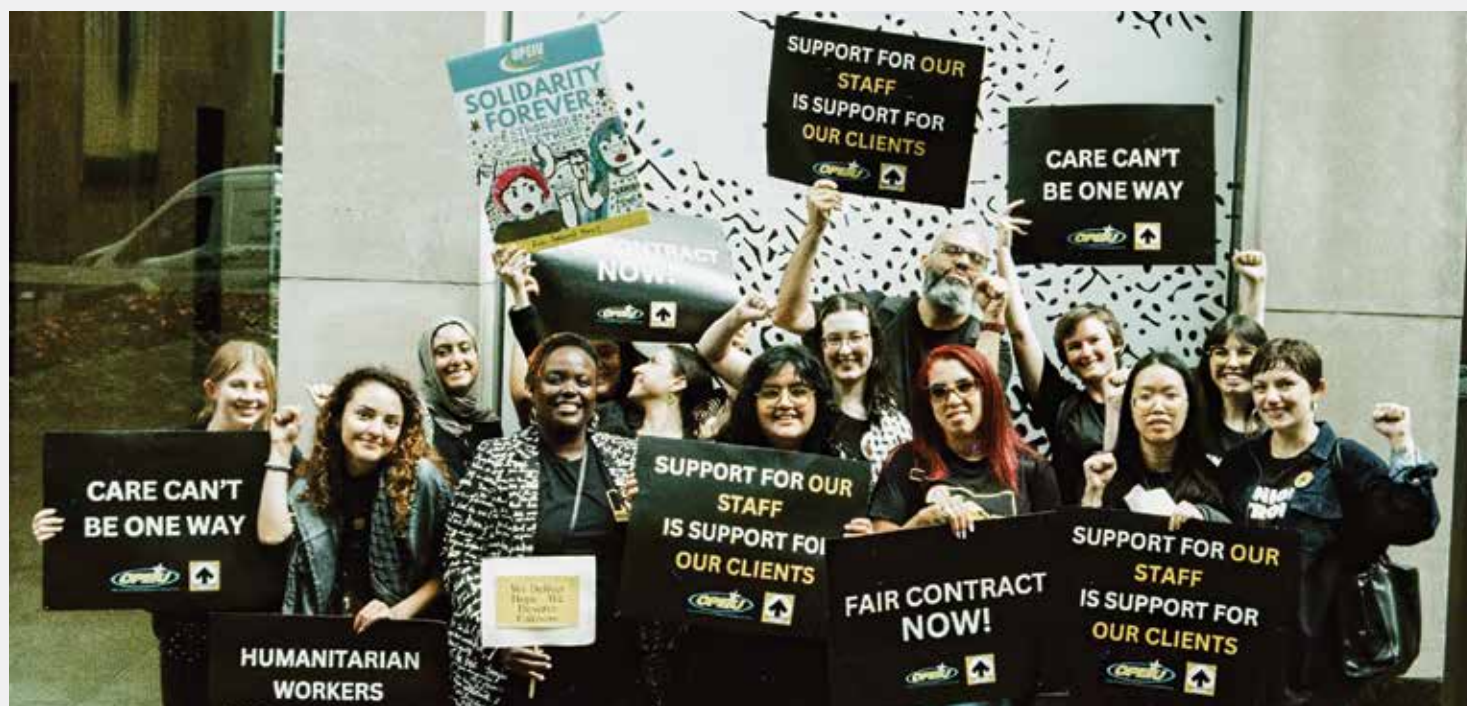
Miembros de IRCWU se manifiestan en las oficinas centrales de IRC en la ciudad de Nueva York en agosto.