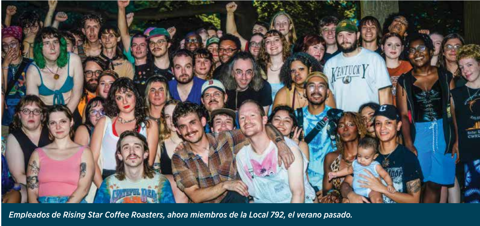
Empleados de Rising Star Coffee Roasters, ahora miembros de la Local 792, el verano pasado.