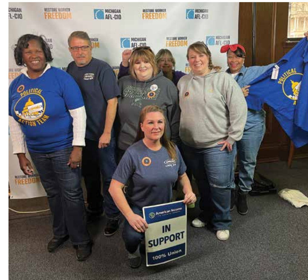
Miembros de la Local 42 de Detroit y de la Local 459 de Lansing (ambas de la Región VII) en 2023 se unieron para luchar con éxito contra la llamada ley de derecho al trabajo de Michigan, facilitando que la gente trabajadora coseche los beneficios de la membresía en la unión.

Al igual que los trabajadores de IRC, que dieron el difícil paso de organizarse, los miembros de la unión trabajan hoy para asegurar que algún día la vida sea un poco más fácil para nosotros y para quienes vengán después.