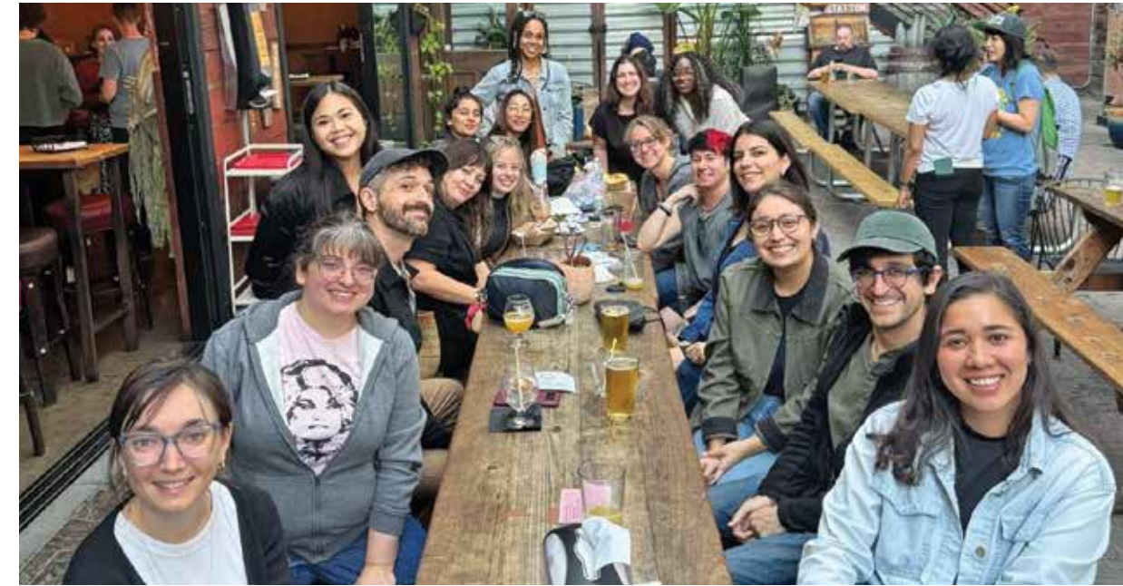
Miembros de CfA Workers United, quienes trabajan de manera remota, se reunieron en un evento en octubre en Oakland.