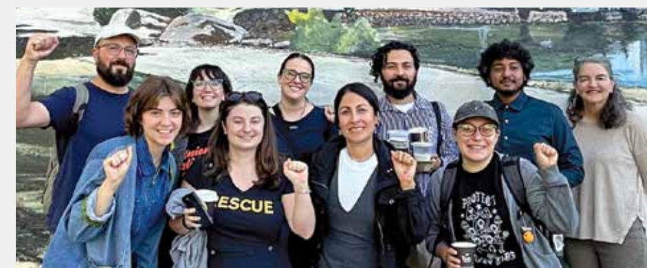
Miembros de IRCWU Oakland en agosto de 2024.

Aunque las distintas oficinas están representadas por diferentes uniones locales, este contrato cubre a los miembros OPEIU en todo el país. Los trabajadores de IRC se inspiraron en los exitosos esfuerzos de sindicalización en algunas de las oficinas internacionales de la organización sin fines de lucro y esperan que su victoria anime a los trabajadores de IRC de todo el país y el mundo, que no pertenecen a la unión, a organizarse.