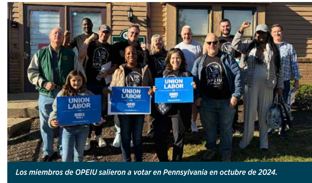
Los miembros de OPEIU salieron a votar en Pennsylvania en octubre de 2024.

Necesitamos su ayuda para asegurarnos de que se elijan candidatos dispuestos a luchar por lo que le importa a los miembros de OPEIU. Aprovechemos al máximo las elecciones de este año y recordemos a nuestros líderes que ellos trabajan para nosotros. ¡Comuníquese con su unión local para ver cómo puede participar!